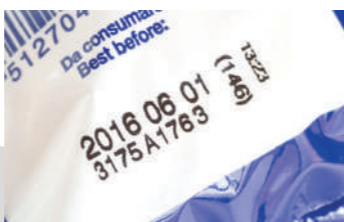
RÓTULOS DE ALIMENTOS