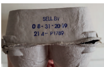
CAIXAS DE PAPELÃO