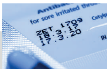
CAIXAS DE MEDICAMENTOS