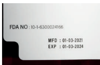
CAIXAS DE ALIMENTOS