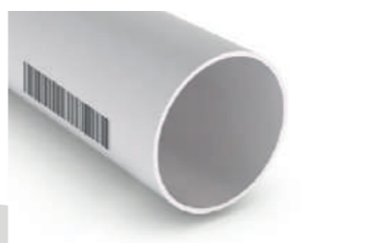
TUBOS DE PVC